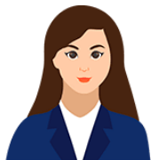
ÓRGANO O UNIDAD ORGÁNICA RESPONSABLE DE LA IMPLEMENTACIÓN DEL SCI