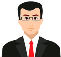
TITULAR DE LA ENTIDAD