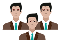
ÓRGANOS O UNIDADES ORGÁNICAS QUE PARTICIPAN EN LA IMPLEMENTACIÓN DEL SCI